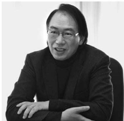
著名なロシア文学者でもある、東京外国語大学の亀山郁夫学長。現在、『罪と罰』『カラマーゾフの兄弟』『悪霊』などドストエフスキーの新訳が光文社文庫から刊行中

「本学は『外国語を学ぶ大学』と捉えられていることが多かったのですが、実際には、地域研究、国際関係研究なども盛んに行わ