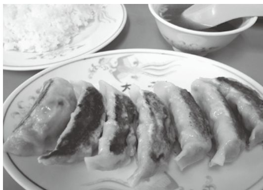
「ギョウザ」は Chinese dumpling または pot stickers

そもそも宇都宮でギョーザが広まったのは、第二次世界大戦後に中国から帰還した兵士たちがその作り方を故郷に伝えたからだと言われています。そして、夏はジリジリと暑く、冬は凍るように寒い宇都宮の気候が、ニンニクのきいたギョーザを食べるのに適していたのではないかとされています。宇都宮が小麦の産地であることも大きな理由の一つでしょう。そして1990年代に、ギョーザの消費量が全国的に高いことを利用して、宇都宮