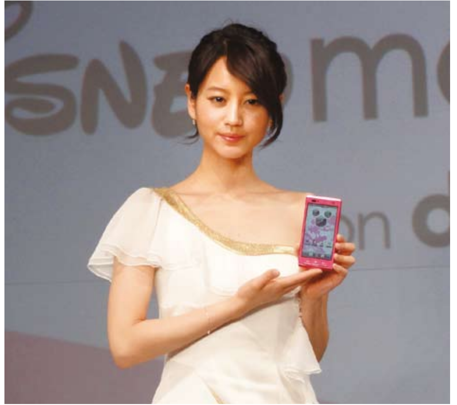
Smart move: Actress Maki Horikita displays an NTT DoCoMo Disney smartphone at a news conference Feb. 1.

While Disney has already been providing its branded phones for use by Softbank Corp.'s network, some applications are exclusive to DoCoMo, the nation's largest carrier said.