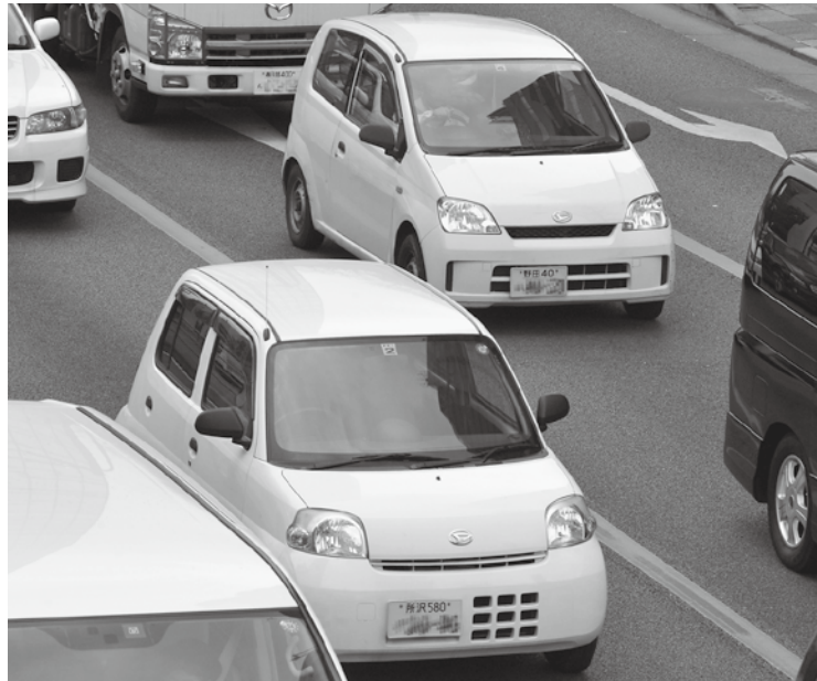
世界でも珍しいほど小型・軽量の、日本の「軽自動車」

日本で起きていることを外国人に伝えるときに必要なのは、英単語の知識や会話力だけではない。物事の背景を理解し、それを外国人にわかりやすく説明するスキルが求められるのだ。このコーナーでは英字新聞 The Japan Times の記者に、記事をより深く理解し、自ら説明できるようになるためのコツを教えてもらう。今回は、ビジネスニュース担当の中田浩子記者に、日米の自動車摩擦と、日本独特の食べ物「ギョーザ」について伺った。