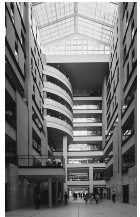
キャンパスの教育と研究の中心となる研究講義棟。デザイン性に富む空間は学生に評判

「今の学生は『内向き志向』と言われますが、現実には、日本の中だけを向いていたのでは生きていけない状況にあります。若いうちに海外に出れば、そのことがよりはっきりと分かるのではないのでしょうか。中国のような、今現在伸びている社会では、若者の目の輝きが違う。語学の習得や専門の研究を高めるということだけでなく、海外に出て得られるものは多いはず。留学して、海外の若者たちの強い精神エネルギーに触れてほしいと考えています」