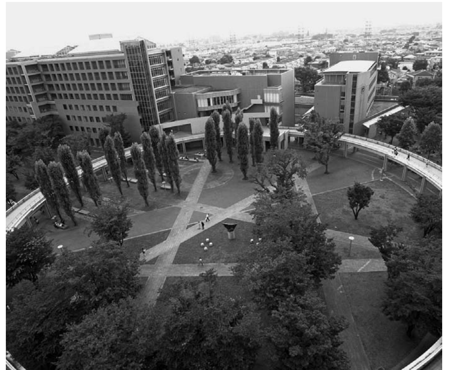
緑豊かな府中キャンパスには、留学生のための寮施設「国際交流会館」も併設されている

に分かれる。「言語文化学部」には、言語について専門的に学ぶ「言語・情報コース」、教育学やコミュニケーション論を専門とする「グローバルコミュニケーションコース」、さらに世界のさまざまな地域の文化・文学などを学ぶ「総合文化コース」がある。中でも「グローバルコミュニケーションコース」では、通訳者として非常に高度なレベルの勉強を行うことが可能になっている。