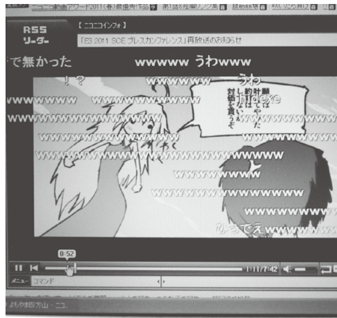
本格的な海外進出もねらうニコニコ動画

日本で起こっていることを外国人に伝えるときに必要なのは、英単語の知識や会話力だけではない。物事の背景を理解し、それを外国人にわかりやすく説明するスキルが求められるのだ。このコーナーでは、英字新聞 The Japan Times の記者に登場してもらい、記事をより深く理解し、自ら説明できるようになるためのコツを覚えてもらう。第2回の今回はビジネス分野を主に担当とする永田一章記者が登場する。