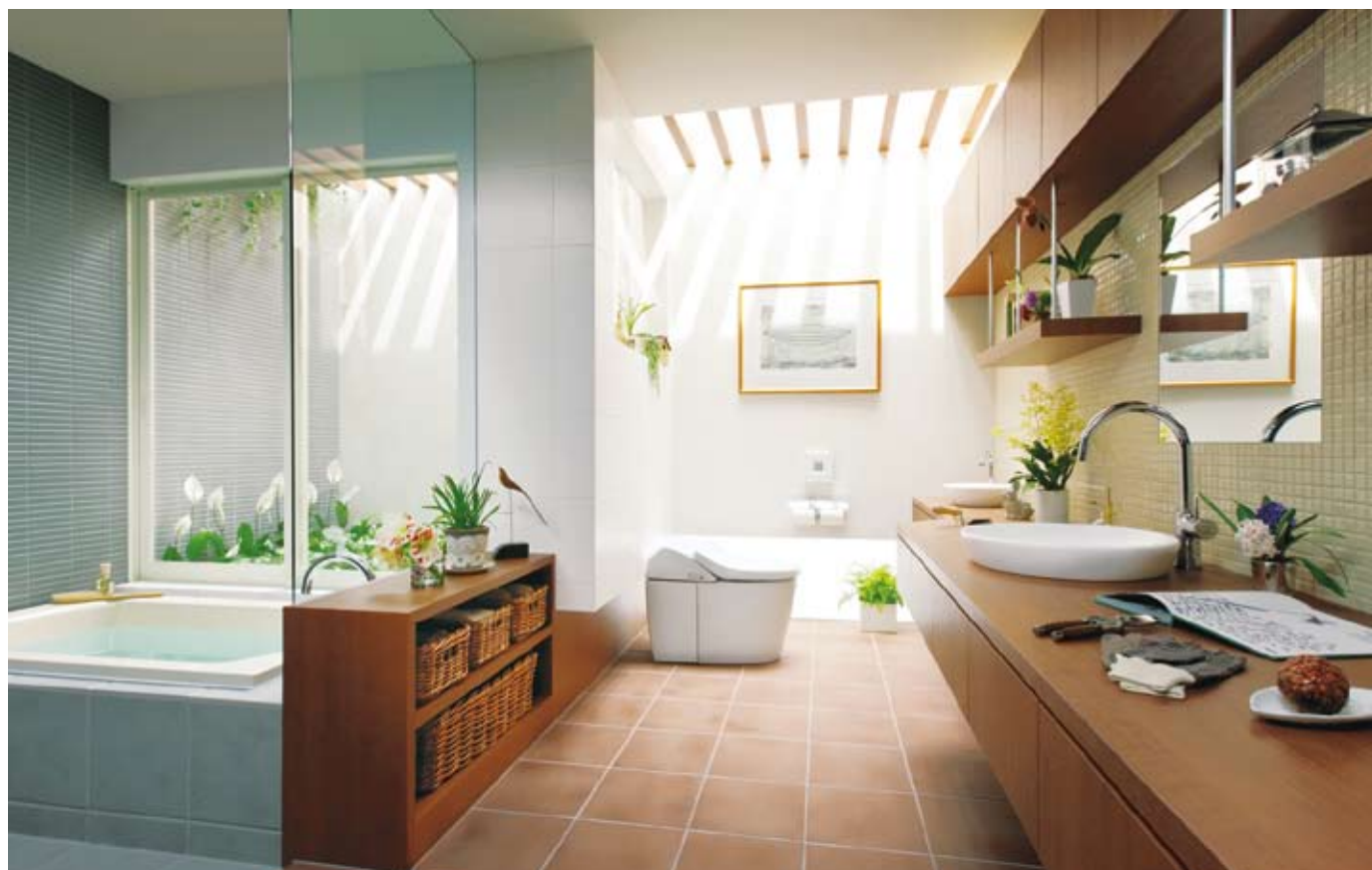
TOTOの最高級トイレ「NEOREST」は全世界共通のブランド。デザインはもちろん、少ない水で確実にきれいにするTOTOの便器洗浄技術は海外でも高く評価される。