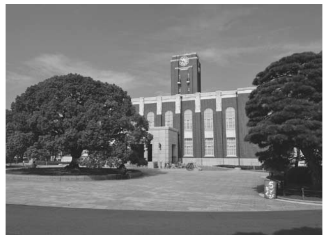
京都大学では短期語学研修や海外農業研修など、さまざまな機会を提供している

海外を経験する機会が豊富な京都大学では、一生の財産を得られる機会も多いかもしれない。