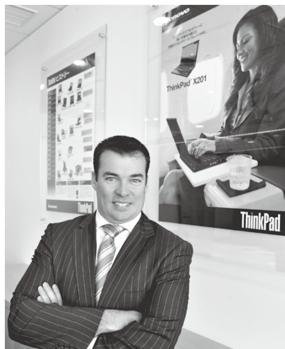
世界第4位のPCメーカー「レノボ」がNECと合併会社を設立

NEC のような巨大な規模の企業が生き残っていくには、これ以上人口が増えることのない日本市場にとどまらず、海外で成功することが不可欠となります。パソコンメーカーに限らず、これからも生き残るために海外に出ていく日本企業は増えることと思います。